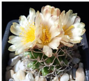
Navajoa peeblesiana var. maia , jižně od Cameron, Arizona