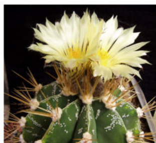
Astrophytum ornatum F.A.C. Weber in Bois - Dict. Hort. 1: 467, 1896.