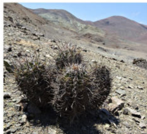
Copiapoa solaris , El Cobres