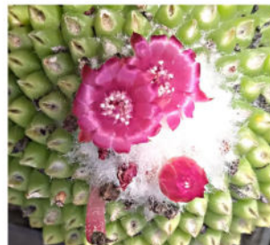
Mammillaria polythele f. inermis Mart. - Nov. Act. Nat. Cur. 328, 1832