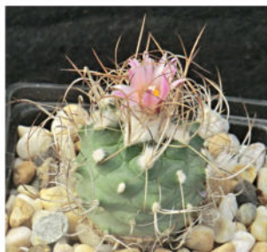
Turbinicarpus roseiflorus Backeb. - Descr. Cact. Nov. 3: 15, 1963.