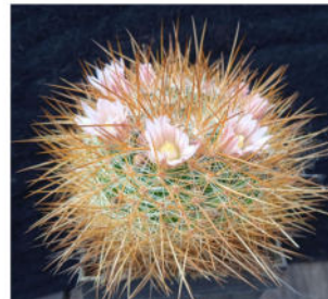
Mammillaria discolor Haw. - Syn. Pl. Succ. 177, 1812.