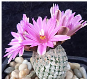
Turbinicarpus valdezianus (Moller) Glass & R. Foster