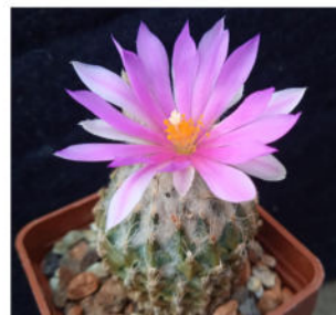
Encephalocarpus strobiliformis A. Berger - Kakteen, 332, 1929.