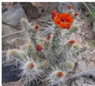
Tephrocactus weberi (Speg.) Backeb., 1935. Secantias