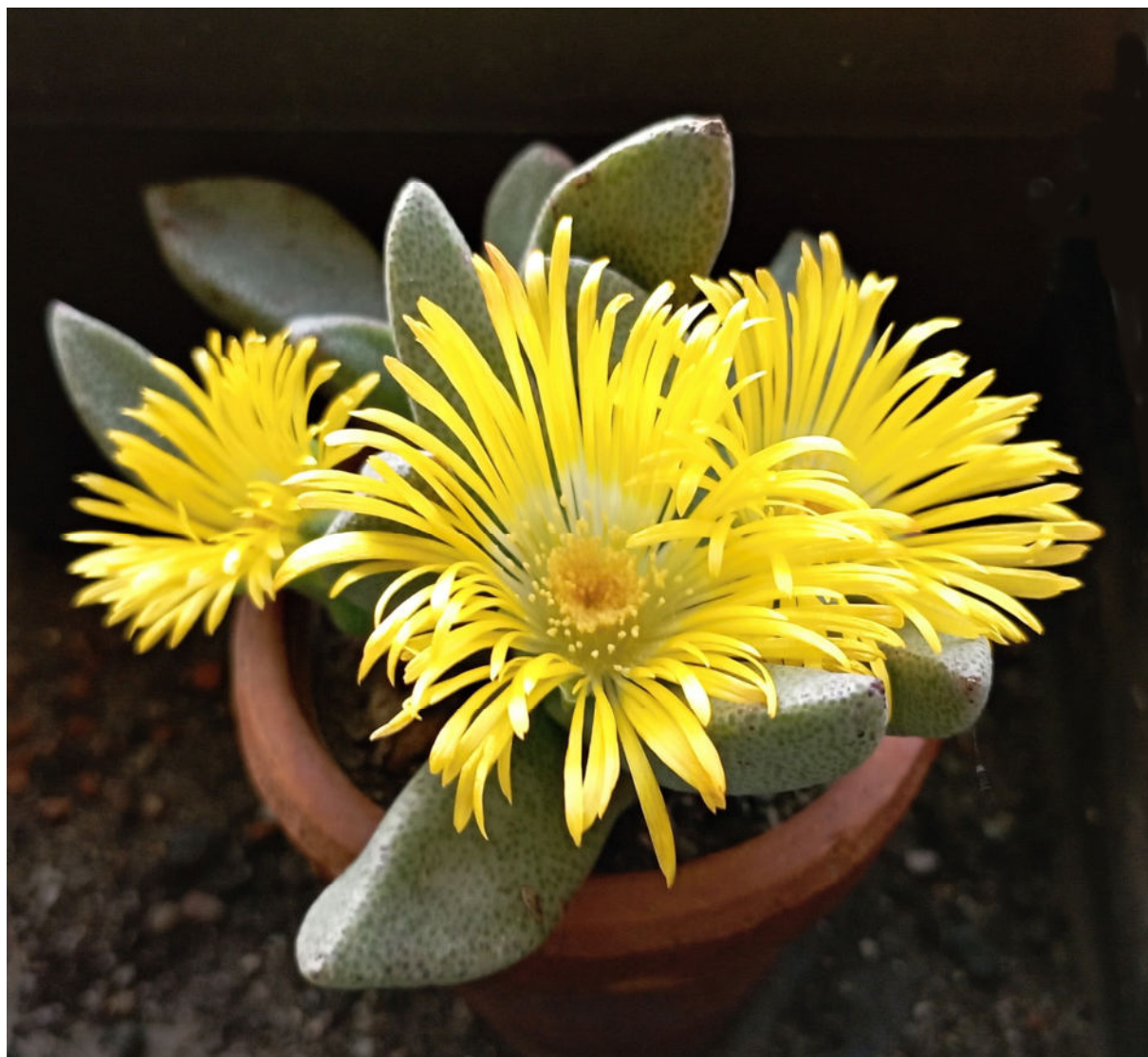
Pleiospilos leipoldtii L. Bolus, 2: 278, 1931.