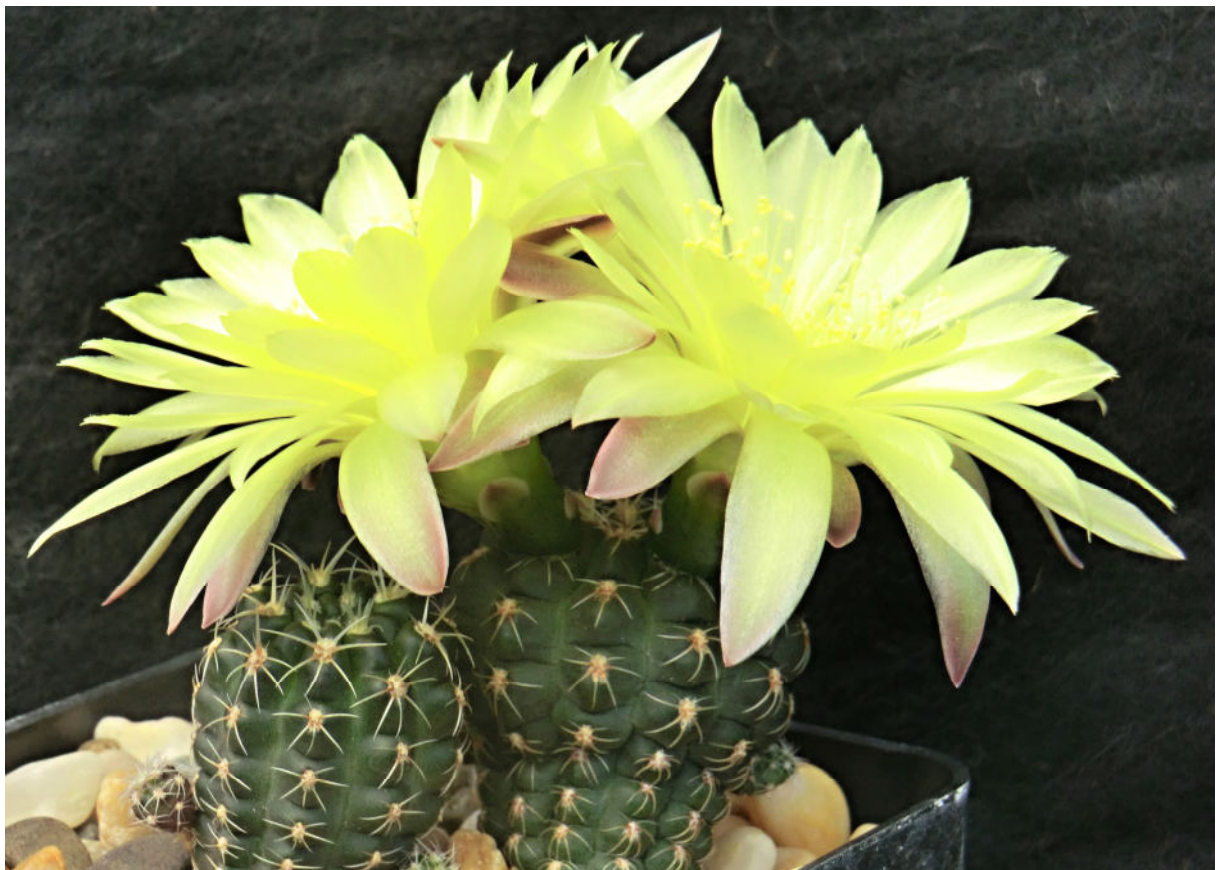
Gymnocalycium andreae var. fechseri , El Mirador 1931 m, KL08-118, (foto Lumír Král)