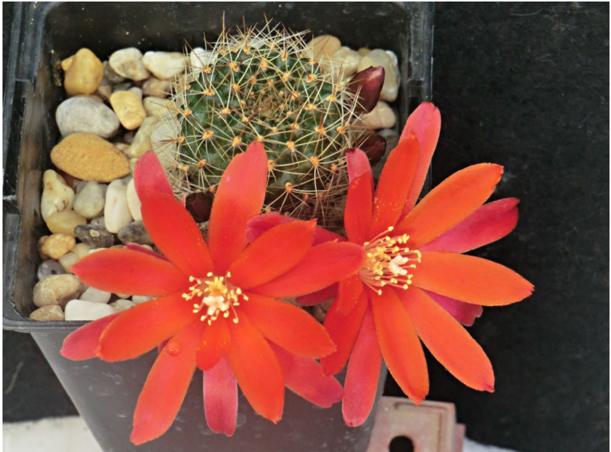
Rebutia friebrii R 503