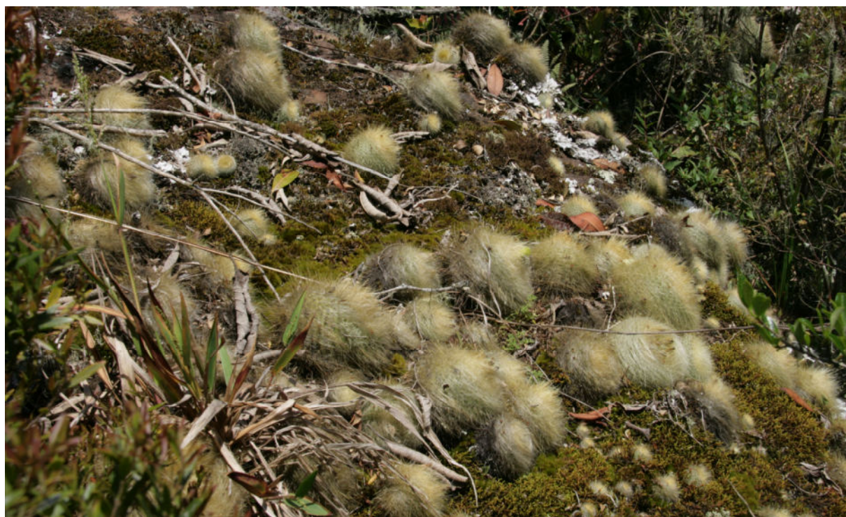
Brasilicactus graessneri STU 744

Prosincová přednáška Ing. Stuchlíka o rodu Brasilicactus bude krásným zakončením letošního kaktusového roku v KKO.