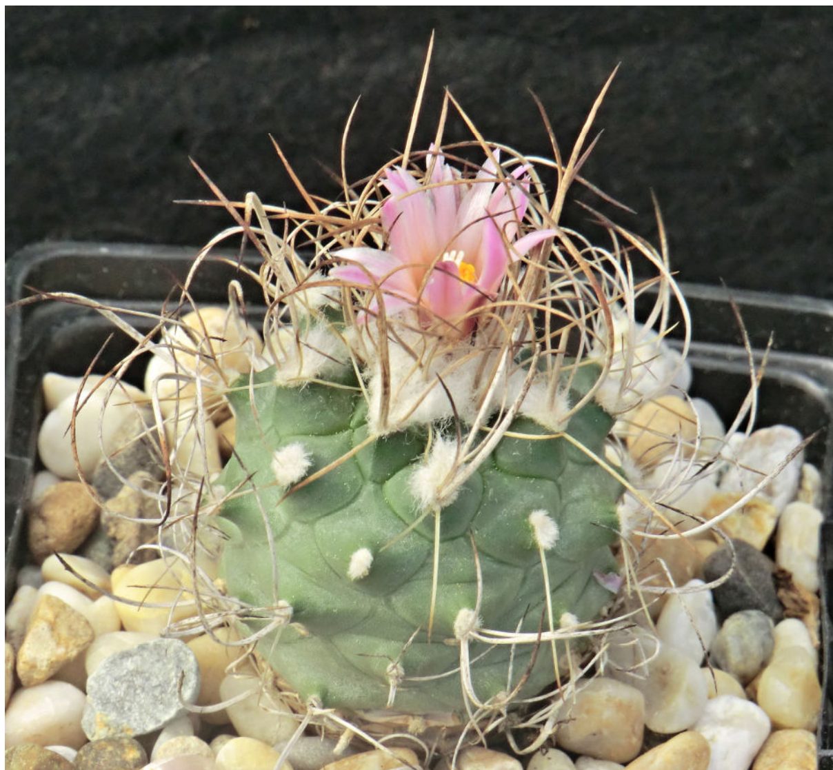
Turbinicarpus roseiflorus Backeb. - Descr. Cact. Nov. 3: 15, 1963.