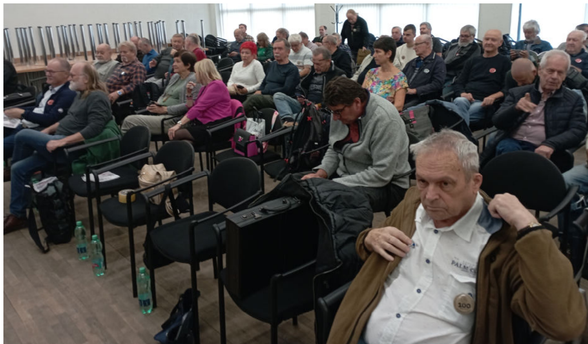
pohled do plného sálu