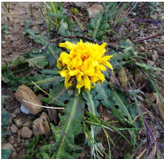
Hypochaeris meyeniana ,