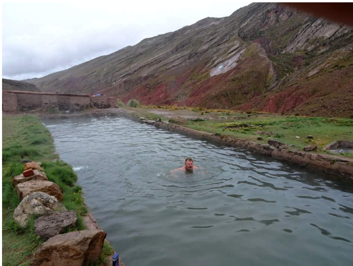
ranní koupel v termálním jezírku OJO DE INCA - Oko Inky

zrovna spadly první kapky deště, nad námi je černý mrak, ale v dále je modro. POTOSI je hornické město, ekologie zde dostává na frač. U pumpy nabíráme benzín za 175 boliviánů. Vyrážíme směr BETANZOS. Na lokalitě (KL17-014) roste Lobivia obrepanda a Cumulopuntia roseana . Mírně nám sprchlo. Na lokalitu ESQUIRI jsme nedojeli, byla to špatná cesta v horách, ale výhledy na krajinu nádherné. Řidič autobusu nám sdělil, že cesta na hlavní spojnici není průjezdná. Vracíme se zpět do POTOSI. Po krátkých přeháňkách se v 17. hodin spustil pořádný liják. Naštěstí děláme delší přesun v autě. V POTOSI už nepršelo. Vyrázili jsme směr ORURO a kousek za městem je termální jezírko OJO DE INCA - Oko Inky, které leží u vesnice TARAPATA. Jedeme se tam podívat. Na příjezdové cestě rostou velké traviny Cortaderia selloana . Místní domorodec nás poslal na spodní jezírko, byla večerní koupačka v teplé vodě - super. Ve vrchním jezírku se údajně utopil nějaký cizinec, kterého vcuclo vřídlo, a vyplivlo ho až druhý den. Od té doby je zde koupání zakázáno. Už zde byl postavený jeden stan, tak jsme přidali další dva. Za chvíli přišli dva mladíci, jeden z Francie a druhý z Buenos Aires. Chvíli jsme s nimi diskutovali, nakonec však s nimi zůstal a při slivovici pokračoval dlouhou diskuzi až do noci jen Pavel. Lépe řečeno, než začalo pršet. Celý večer létaly blesky a po 21. hodině začalo hodně pršet. Prakticky lilo celou noc.