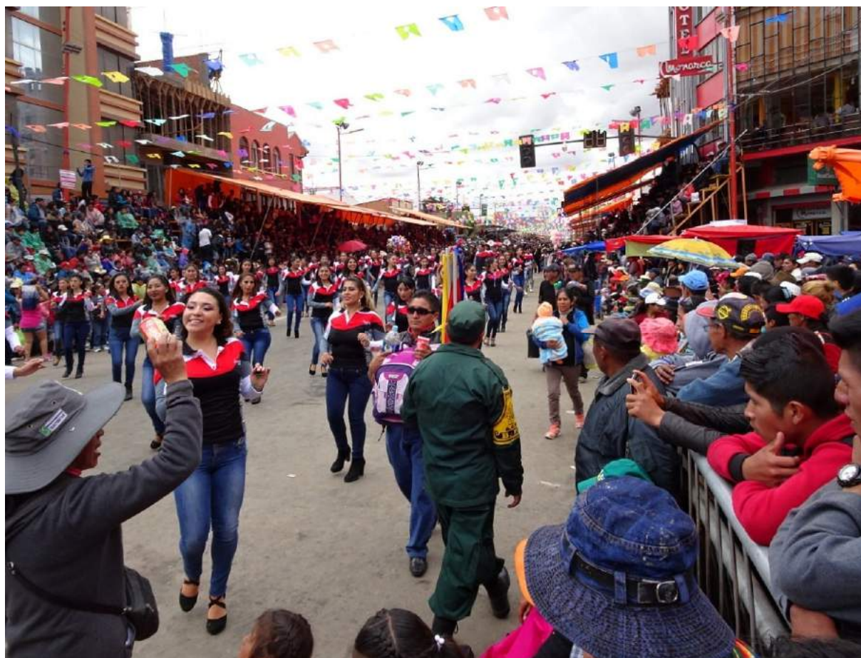
slavnosti tance a hudby v ORURO