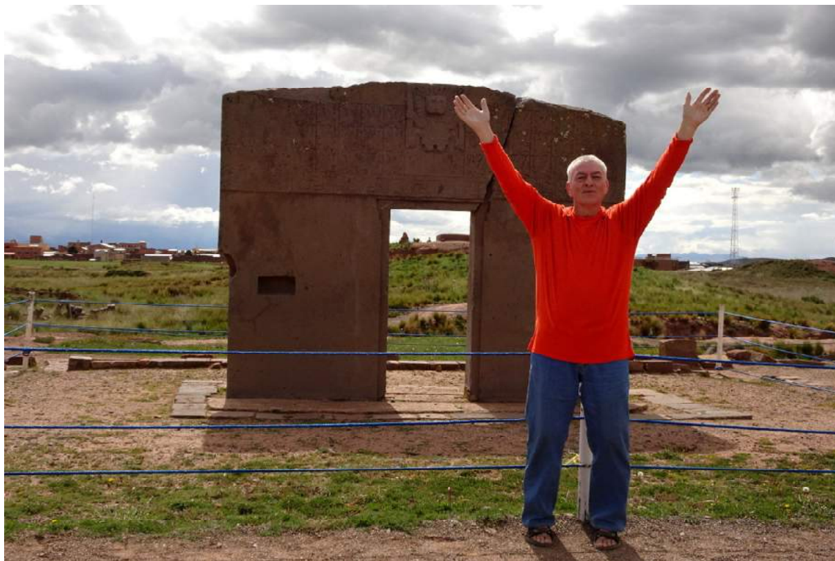
u jezera TITICACA leží bolivijské ruiny TIWANAKI - nejvýznamnější památka je brána Slunce

Vyrážíme k Peru, abychom sehnali nocleh co nejbližší k hranici. V dále hrozí černé mraky, ale uvidíme, jak to dopadne. Nakonec jsme dojeli až na hranici. Vyřídili jsme si emigrační papíry. Zpočátku jsem měl problém, nemohl jsem najít emigrační papírek, který jsem si důkladně schoval. Pavel říkal, postupuj systematicky, nakonec