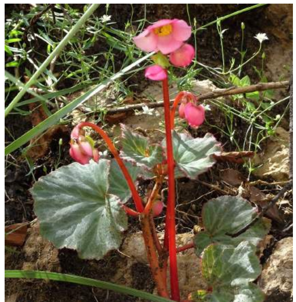
Begonia fischeri , Cochabamba