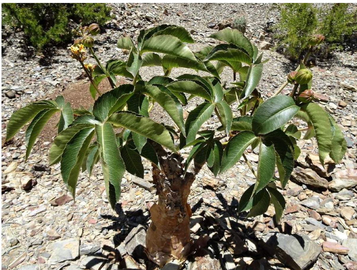
Jatropha pachypoda , PAICHO CENTRO, 2631 m, (KL17-005)