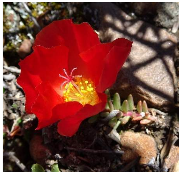
Portulaca eruca , před Tarabuco, 3365 m,