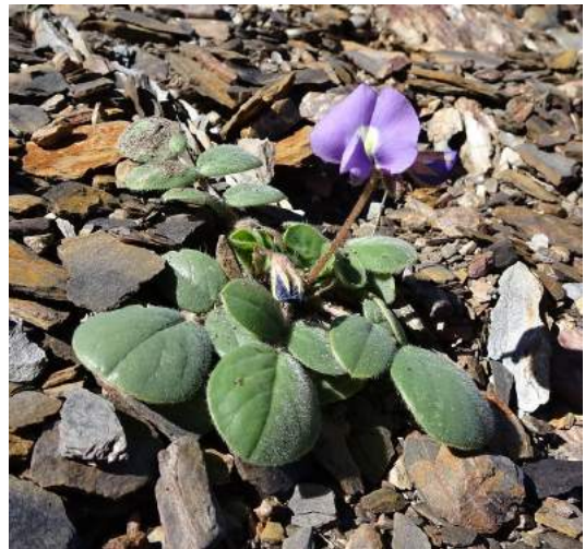
Centrosema schottii , Millares