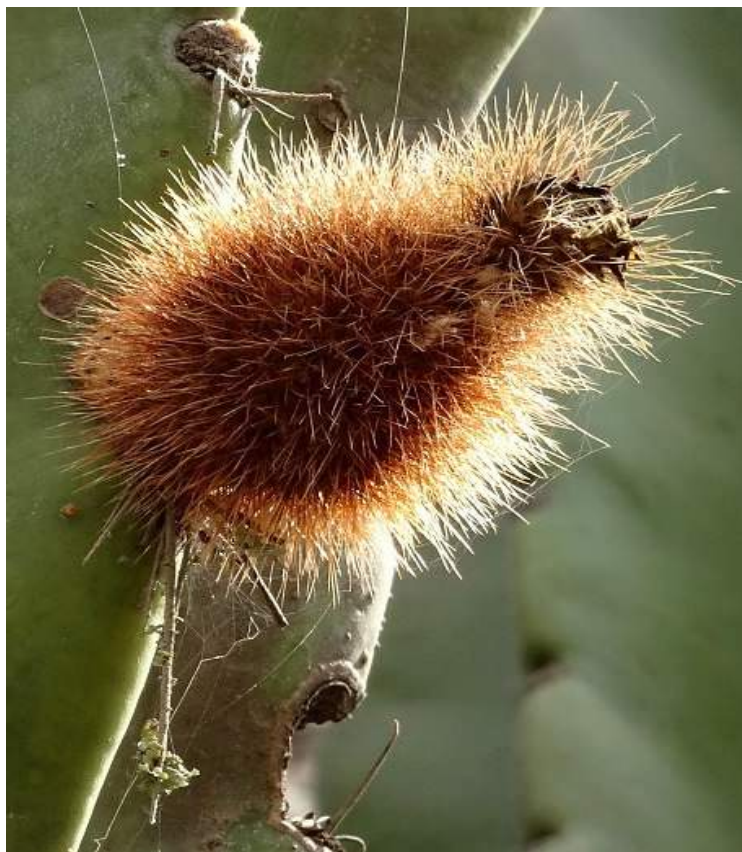
Neocardenasia (Neoraimondia) herzogiana a plod, ENTRE RIOS - PALOS BLANCO, (KL17-002)