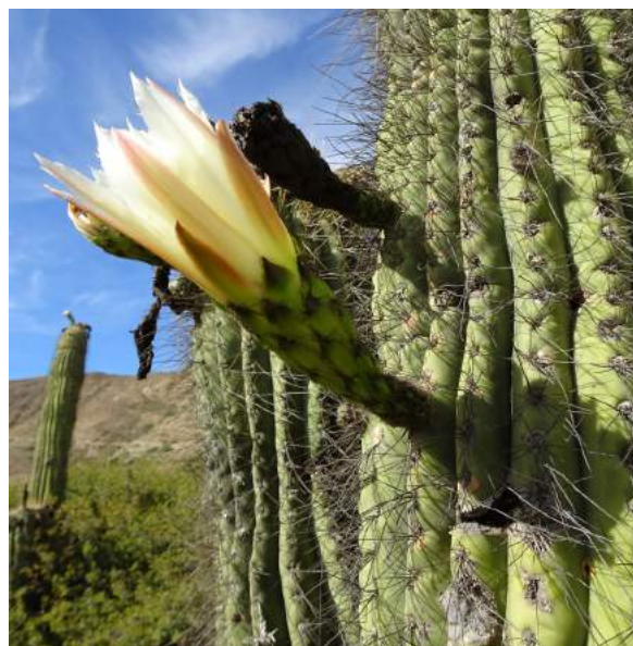
Oreocereus trollii a Trichocereus tarichensis , před PAICHO, 3202 m, (KL17-003)