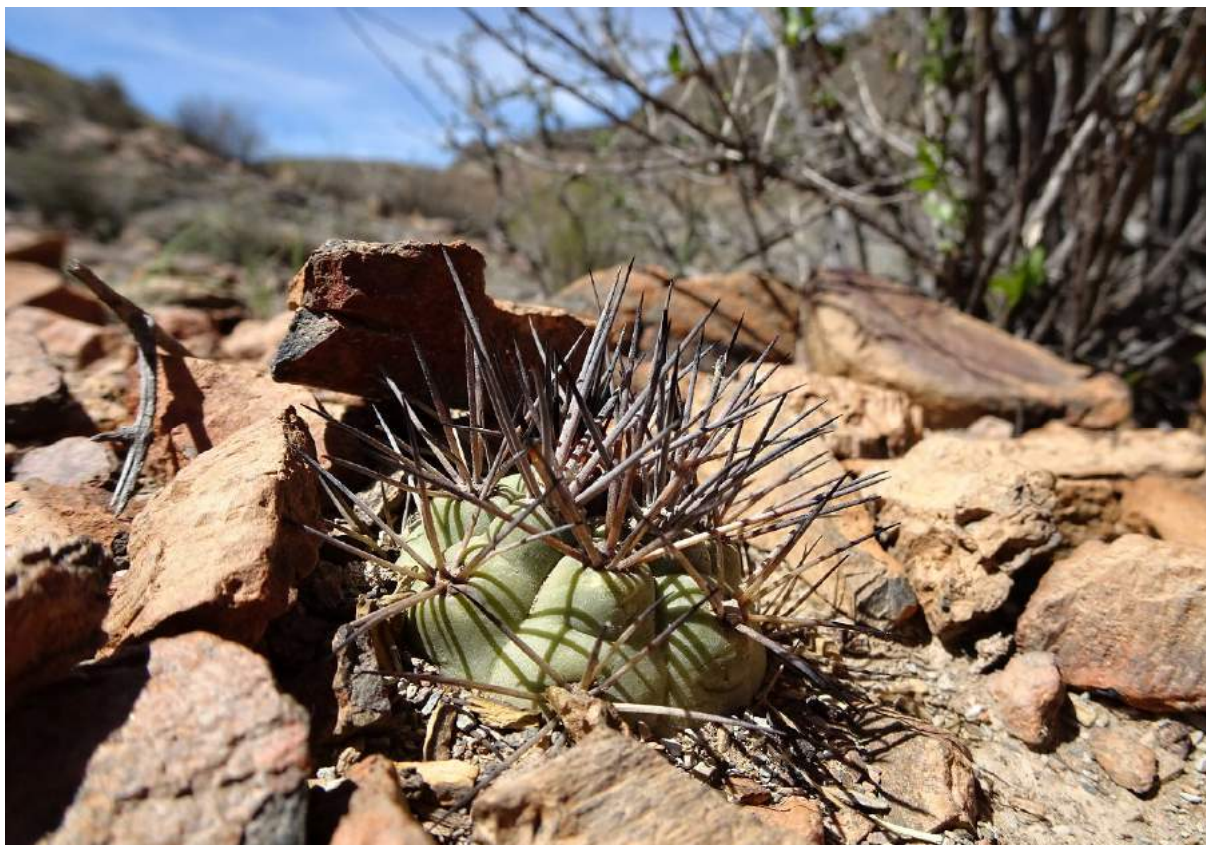
Weingartia amerhauserii , 7 km jižně od PAICHO CENTRO, 2779 m, (KL17-004)