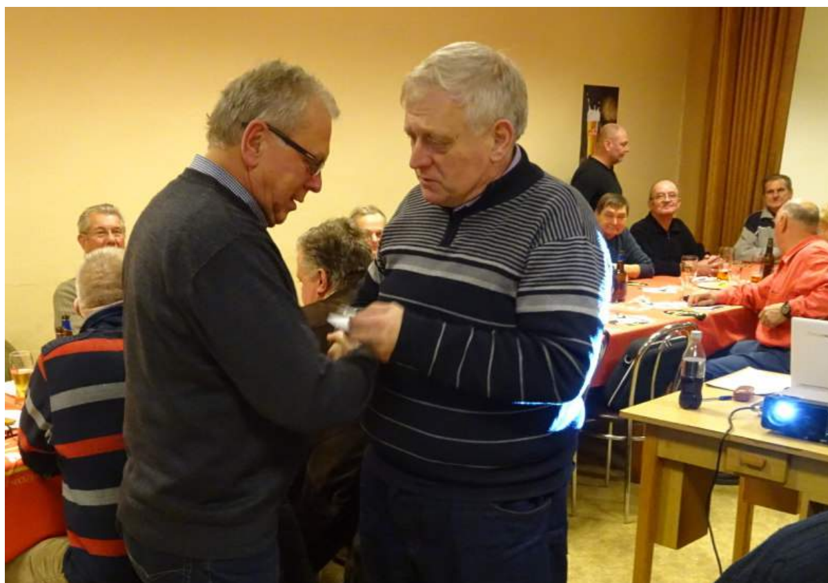
Polský prezident Andrzej Wandzik předává ocenění za zásluhy PTMK Jaroslavovi Víchovi