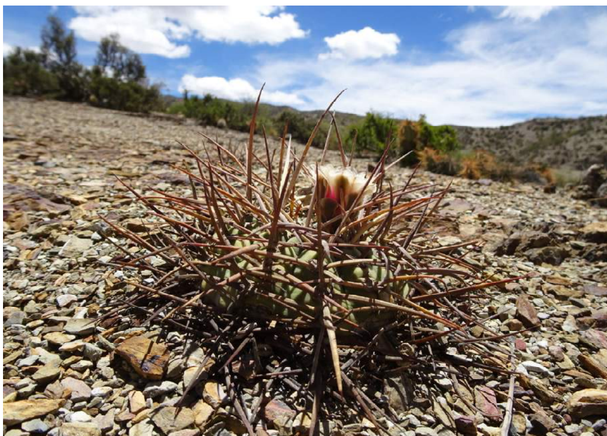
dva obrázky nádherně vytrněného Gymnocalycium armatum , PAICHO CENTRO, 2629 m, (KL17-006)