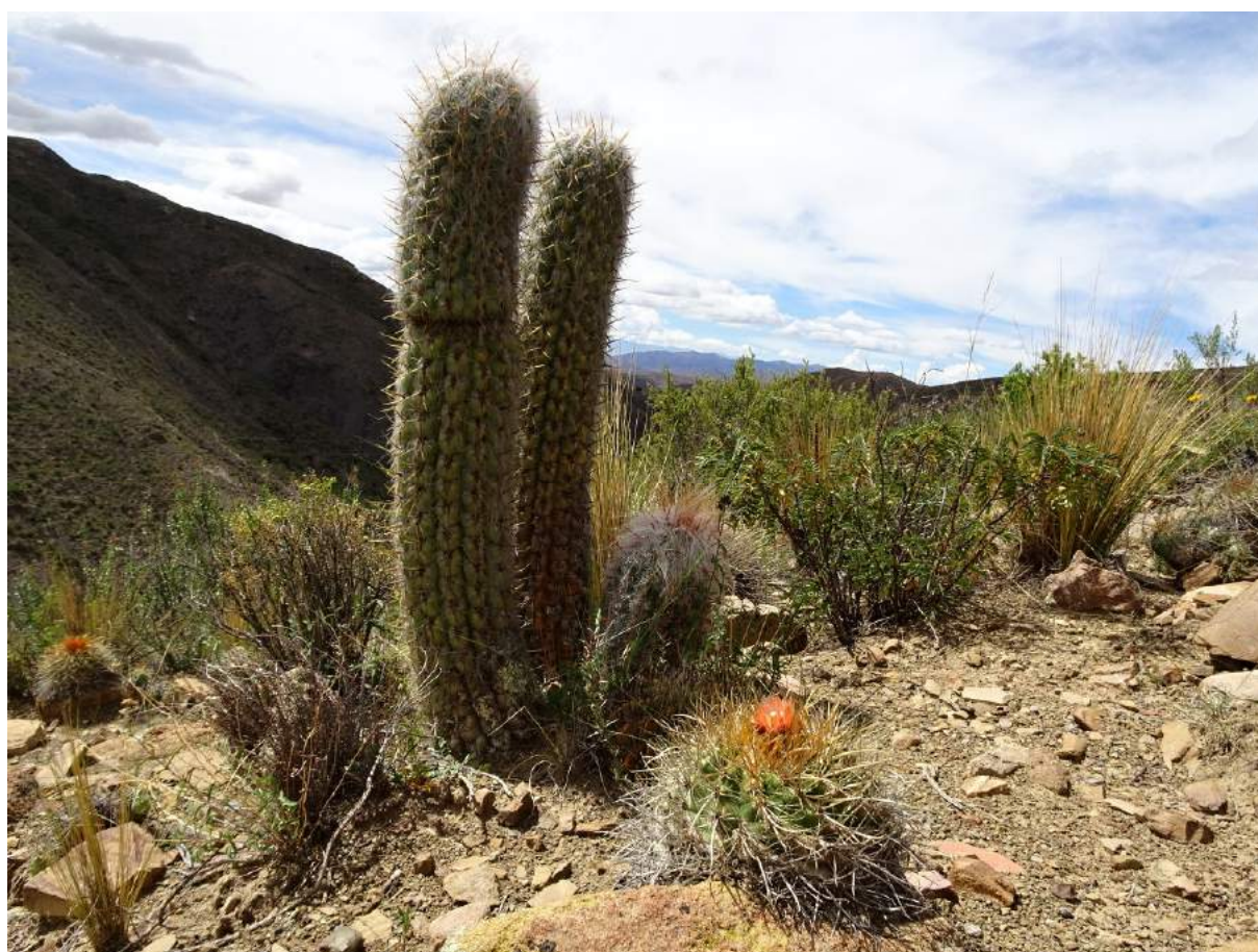
Oreocereus celsianus a Parodia maasii u Cucho Ingenio, 3786 m, (KL17-013)

Roste zde Oreocereus trollii , Lobivia maximiliana , na lokalitě (KL17-011) jsou i semena. Na další zastávce, na pokyn Pavla jsme zastavili a jsou zde, hurá (KL17-012). Roste zde Weingartia pygmaea a další. Před TUPIZA stojí dva indiáni s motorkou a měli nějaký problém. Udělali jsme dobrý skutek a jednoho odvezli do města. Nabrali jsme benzín za 237 boliviánů. Petra vybrala po 200 boliviánů. Jdeme něco nakoupit na jídlo a frčíme do hor, směr SAN VICENTE. Zastavili jsme na S21 27.058 W65 49.365, 3902 m, ale nenašli jsme skoro nic, nějaké lobivie, ale Weingartia neumanniiana není, i špatný výsledek je výsledek. Zajeli jsme kousek dále a otočili jsme se, mezitím Petra našla Neowerdermannia vorwerkii . U města TUPIZA jsou nádherné skalní červené útvary. Vyrážíme směr POTOSÍ po krásné asfaltové cestě. Jedeme přesunem do 18.30 hodin, kdy už se začíná stmívat. Nacházíme místo pro stany, kousek od cesty, z druhé strany od potoka. Je to mezi TUPIZA a POTOSI. V dáli jsou černé bouřkové mraky. Je však příjemný, teplý večer, chvíli jsme s Pavlem pokecali, samozřejmě ne po suchu.