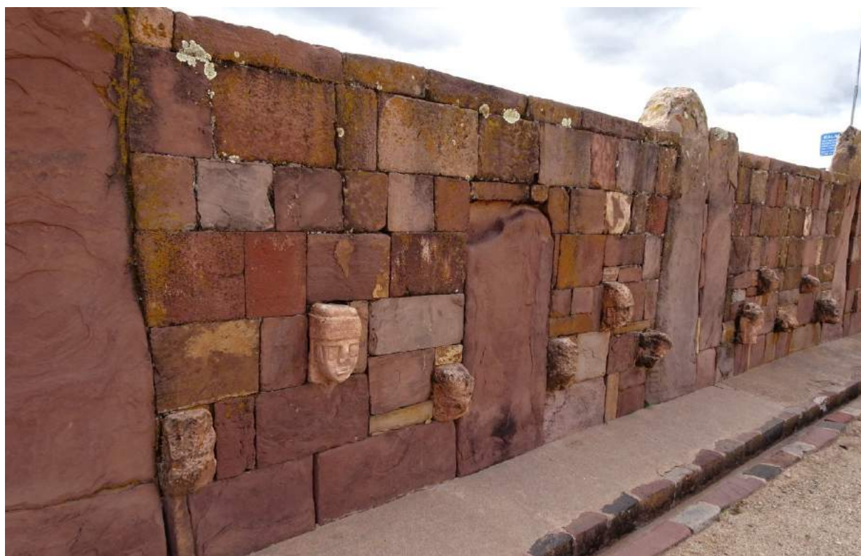
nahoře: protáhlá lebka není dle DNA lidská, temenní deska je zcela bez švu, stáří asi 3000 let dole: náměstí je obehnané zdí, do které je vsazeno 175 hlav, představující rasy z celé Země