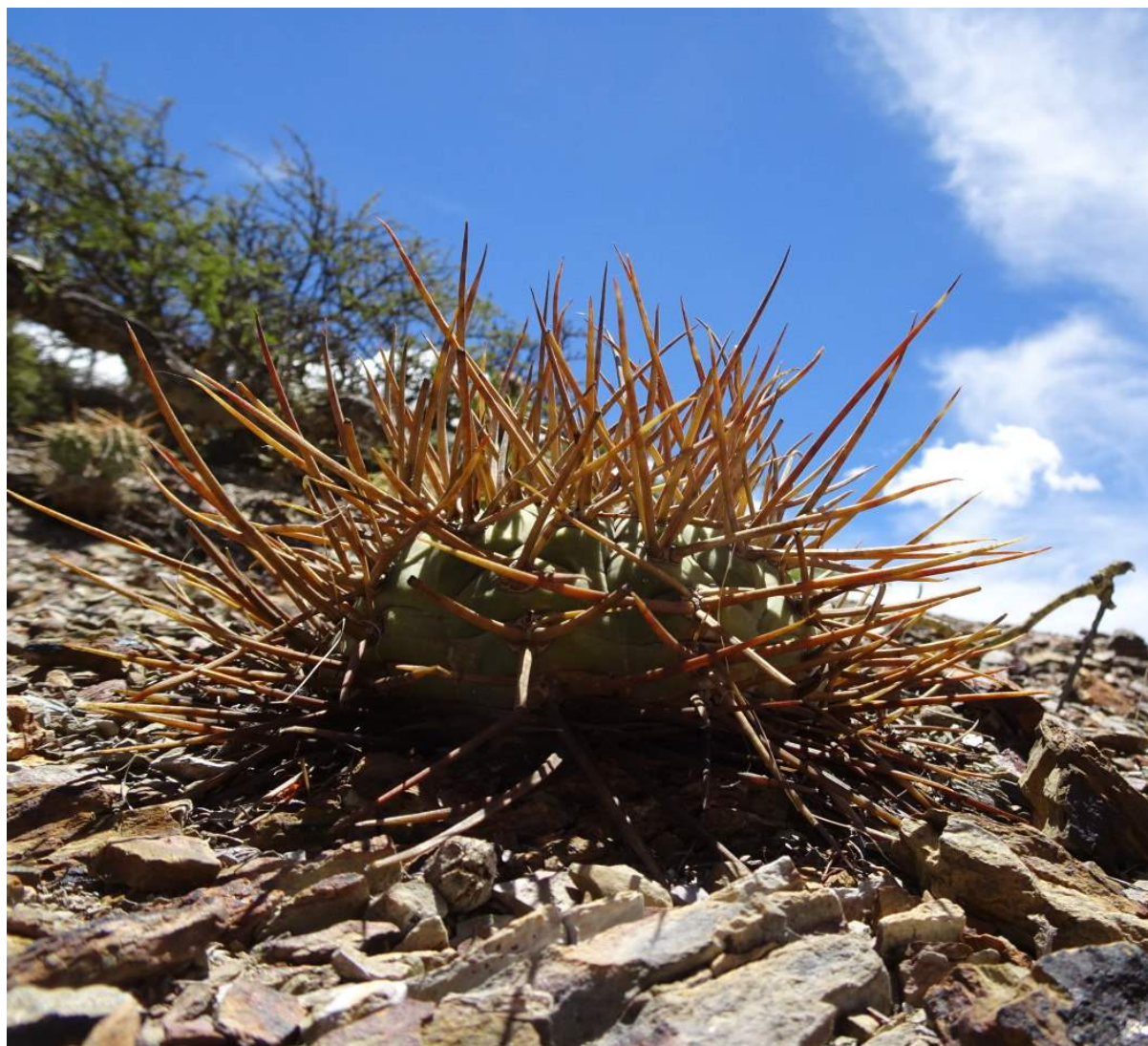
Gymnocalycium armatum , PAICHO CENTRO, 2629 m, (KL17-006)