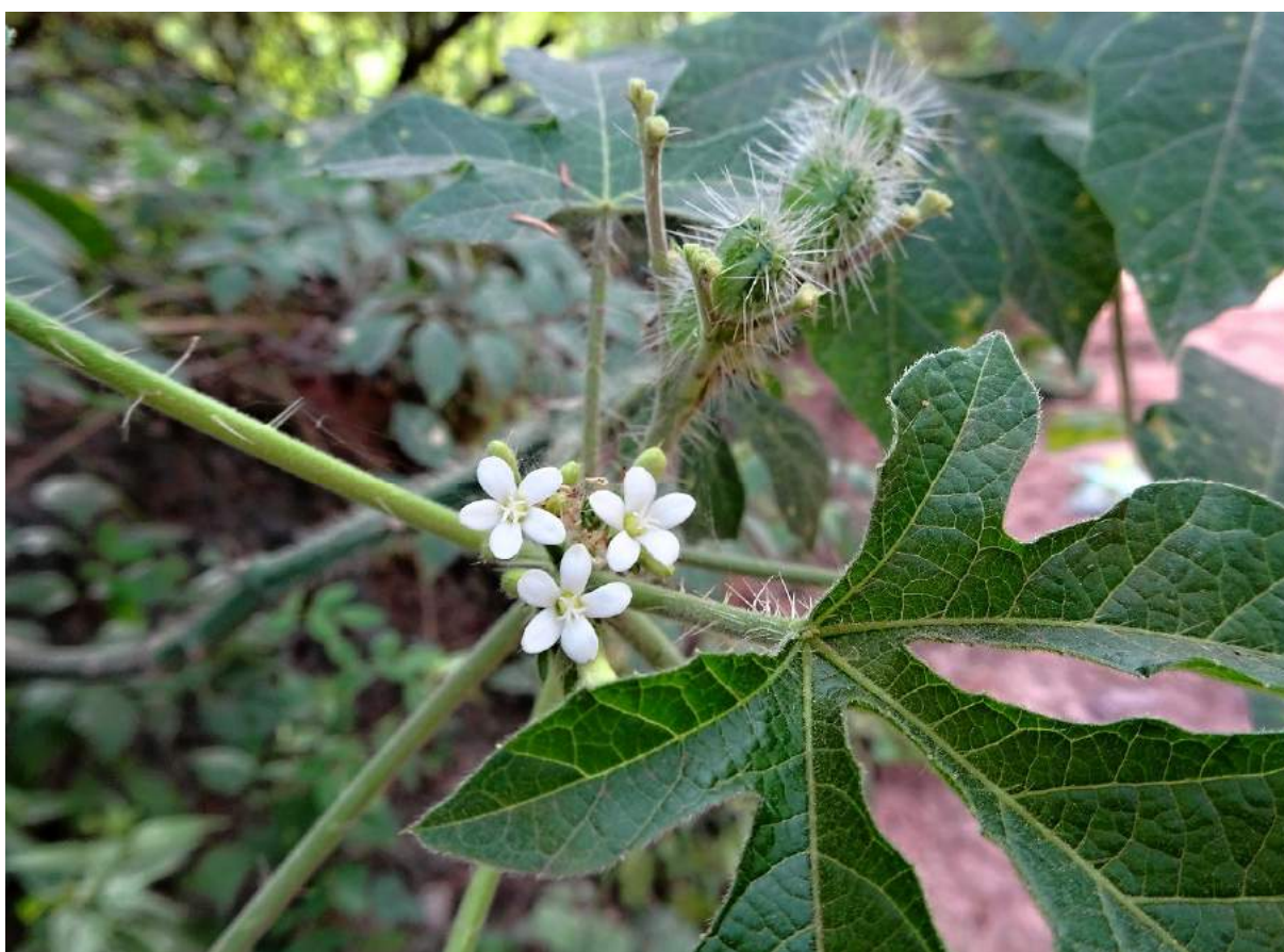
nahøfe: kvetoucí Chorisia speciosa , dole: Jatropha (Cnidoscolus) urens , 973 m, (KL17-002)