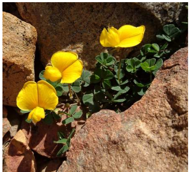
Arachis glabrata , před Tarabuco, 3365 m