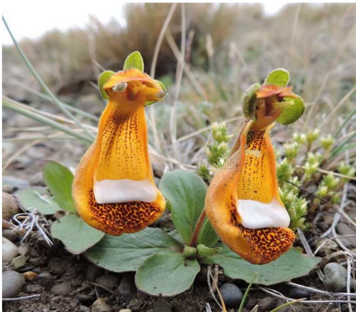
Calceolaria uniflora , Rio Gallegos, KL13-056, 21. 11. 2013