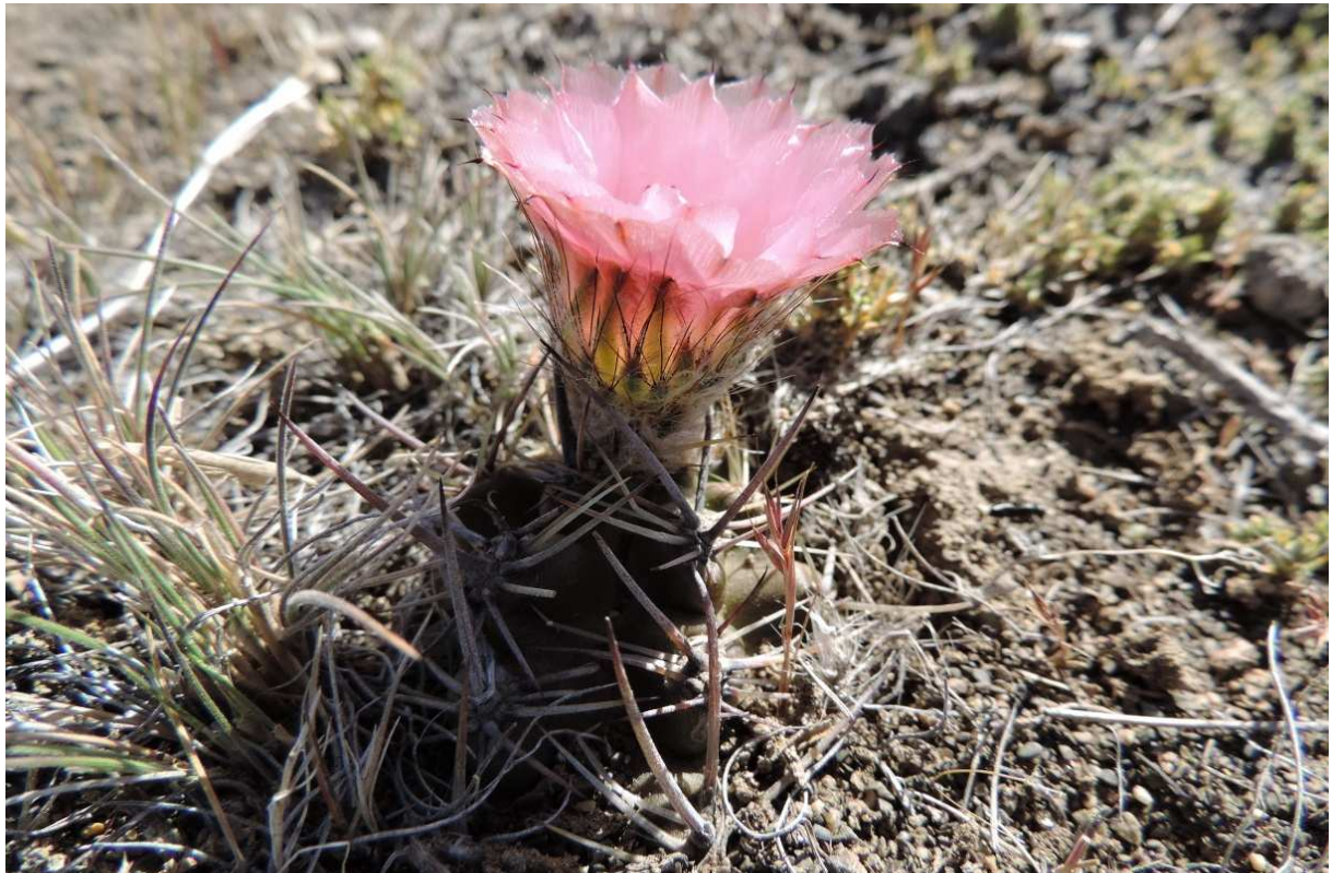
Austrocactus sp., KL13-061, Lago Viedma, R21, 6 km od La Leona