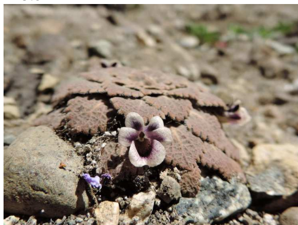
Viola vulcanica , KL13-076, San Carlos de Bariloche

coccineum , keře někdy až několik metrů vysoké. Je to zde pěkná turistická oblast se spoustou památek a rezervací, všude nabízejí ubytování v cabañas, je tu však i několik kempinků. Našli jsme jeden pěkný na kraji města, nikdo zde není. GPS: S41 58.041 W71 31.643, nadmořská výška 302 m, i když je to pod horami a na nich sníh, je zde teplo, zatím nejteplejší večer. Dorazili jsme do kempu v 19.15 hodin. Na recepci je mladý kluk s dredy a je ochoten nám vyměnit dolary za pesa 1 USD = 8 peso. Je to pro nás velmi výhodná výměna. Vyměnili jsme 300 USD, víc neměl, zbytek snad až ráno. Noc klidná, o půlnoci přijelo auto, jinak jsme zde sami, pěkné místo.