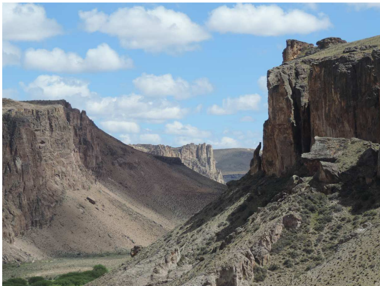
údolí řeky RIO PINTURAS, kde se nachází jeskyně rukou CUEVA DE LOS MANOS PINTADAS

svítí, je zima jako prase. 39 312 stav tachometru při výjezdu v 9.30 hodin. Načepovali jsme benzín, pumpu obsluhuje náš hoteliér. V roce 2010 jsme zde benzín nebyl a museli jsme jet 120 km na špagátě, letos je to už lepší. Po třech kilometrech odbočujeme na CUEVA DE LOS MANOS PINTADAS na RP 97, kde by měly být kresby rukou, staré 9 300 let před n. letopočtem. Už se těším. Z odbočky je to asi 45 km. Cvičná procházka asi 10 km před kresbami, žádné kaktusy jsme neviděli, jen nás profoukl silný arktický vítr. Vstupné do kaňonu s kresbami stálo 50 peso. Procházka kaňonem byla fantastická, nádherné výhledy, doplňované skalními kresbami rukou a zvířat. Nemělo to prostě chybu, GPS - S47 09.383 W70 39.464, 525 m.