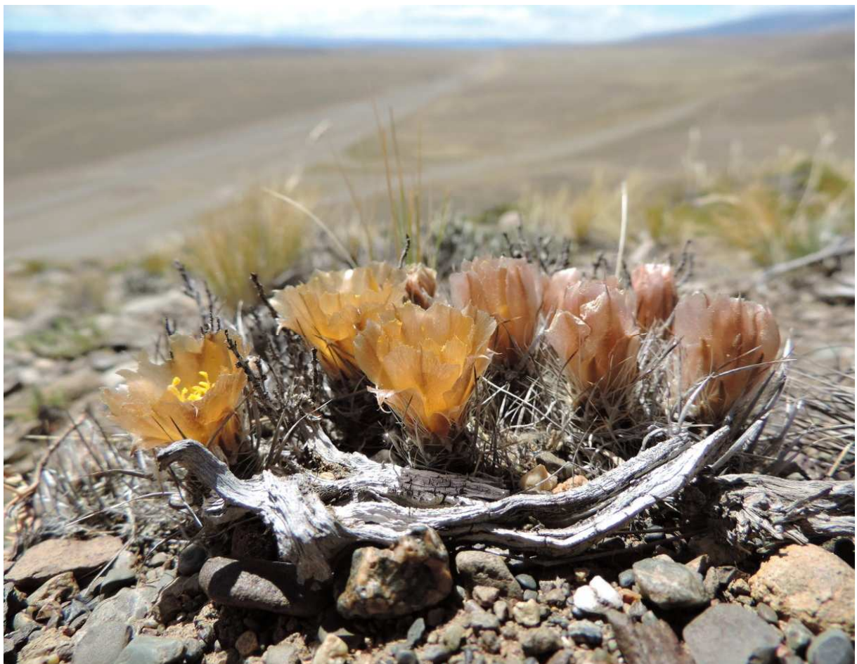
Pterocactus australis, KL13-060, odbočka R2, A Piera Bueno, 50km El Calafate, 22.11.2013