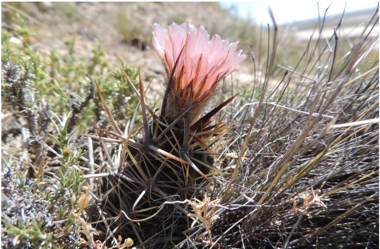
Austrocactus sp., KL13-055, 1 km za Rio Chico, 20.11.2013