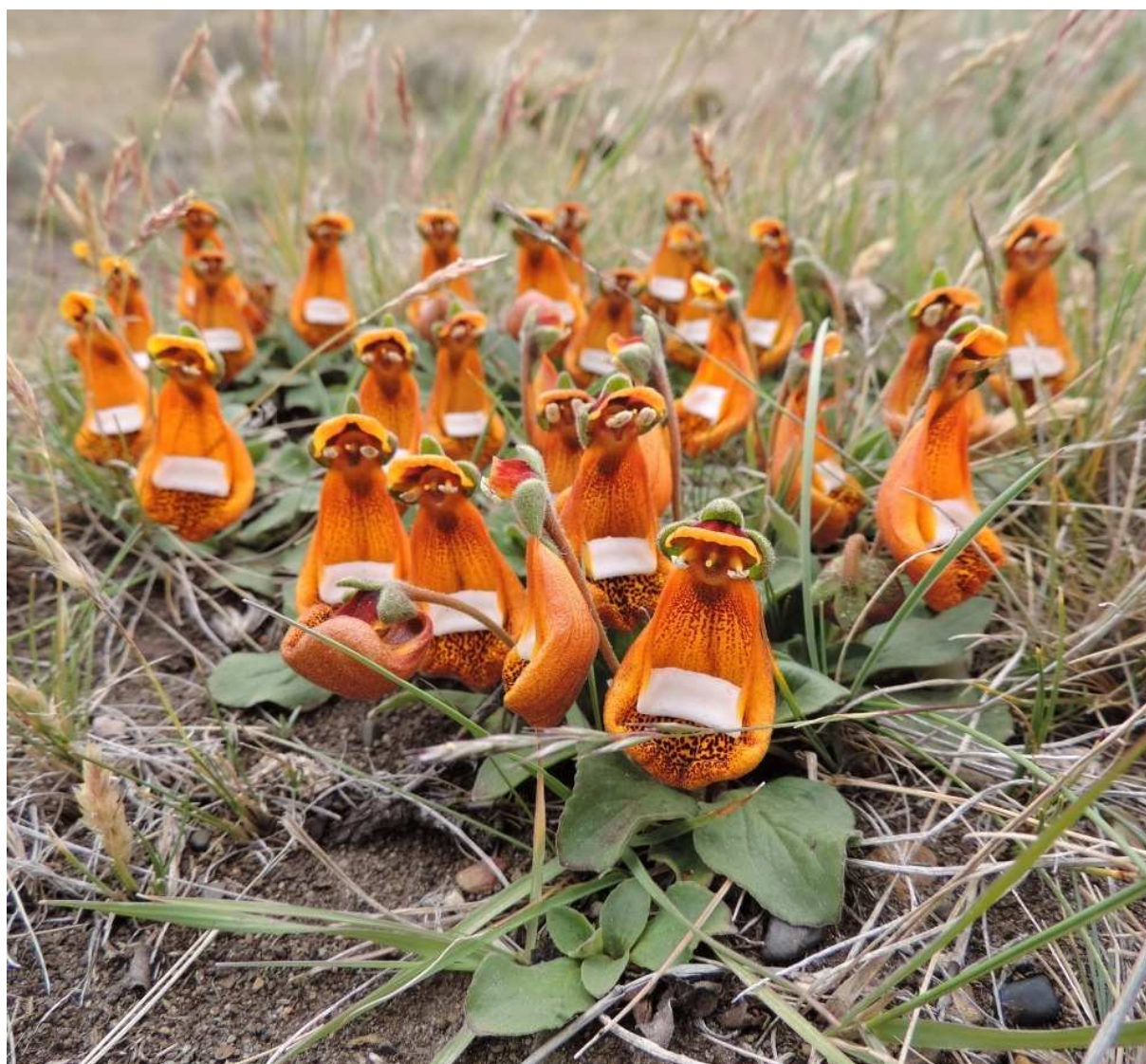
Calceolaria uniflora, Rio Gallegos, KL13-056, 21.11.2013